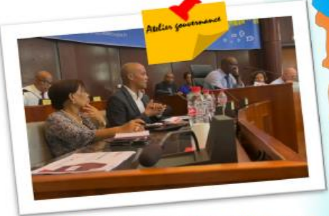
Atelier « Gouvernance », le 31 mai 2023 à l'Hôtel de Région à Basse-Terre