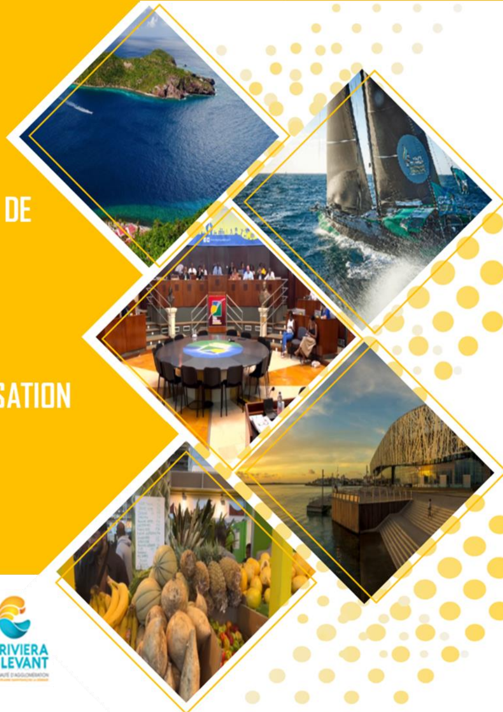
SCHÉMA RÉGIONAL DE DÉVELOPPEMENT ÉCONOMIQUE D'INNOVATION ET D'INTERNATIONALISATION SRDEII