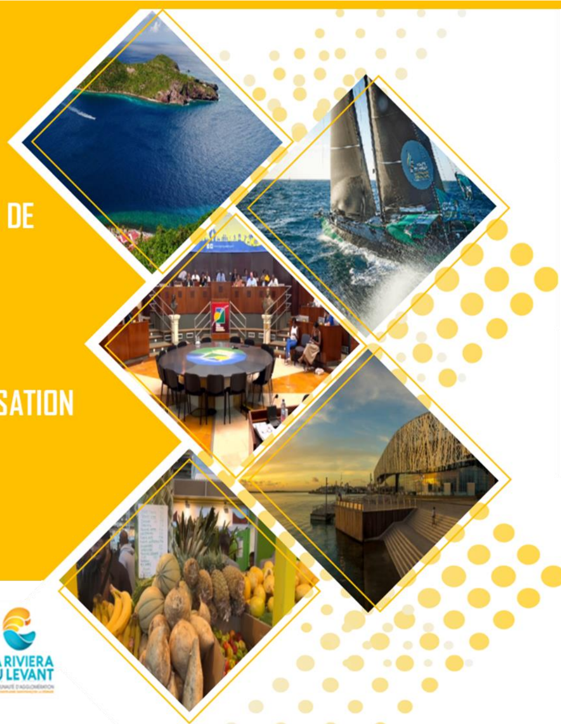
SCHÉMA RÉGIONAL DE DÉVELOPPEMENT ÉCONOMIQUE D'INNOVATION ET D'INTERNATIONALISATION SRDEII