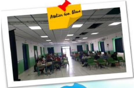
Atelier « Economie bleue », le 13 avril 2023 à la Salle Louis-Daniel BEAUPERTHUY à Sainte-Rose