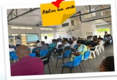
Atelier « Economie verte », le 24 avril 2023 à la Maison de « La Paysannerie » à Petit-Canal